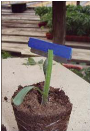
Figura 2. Preparación del rizoma con corte vertical.

Ver varios tipos de técnicas de injerto de tomate demostradas por Ohio State University, visita http://www.youtube.com/watch?v=tHnOYcl6B44 .