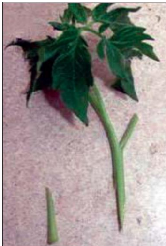
Figura 3. Prep. del vástago.

Si se permite que el vástago se asiente en el suelo, la planta puede volverse susceptible a cualquier enfermedad transmitida por el suelo que esté presente.