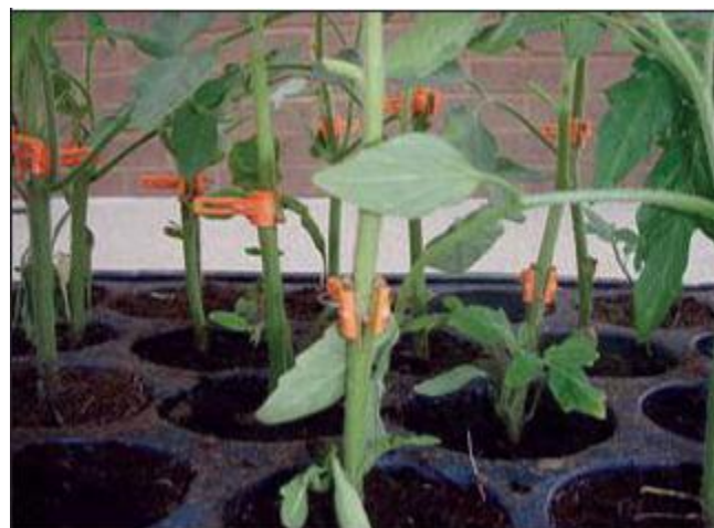
Figure 5. Sanando la unión del injerto.