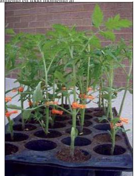
Figura 6. Plantas curativas.

Dado que el injerto implica hacer una herida en la planta, los cultivadores deben ser conscientes de que las heridas pueden proporcionar sitios de entrada para diversos organismos de enfermedades en la planta. Se debe practicar un buen saneamiento en todo momento al realizar injertos. Si la unión del injerto no es lo suficientemente fuerte o no mantiene un buen contacto, los tallos pueden estar desfigurados e incapaces de soportar las hojas y las raíces..