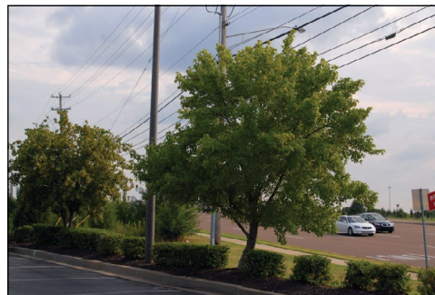
Arce de Shantung (Tabla 1)

otros debido a su corta vida útil o al exceso de residuos de flores, frutos o madera quebradiza (Tabla 5). Antes de plantar cualquier tipo de vegetación,