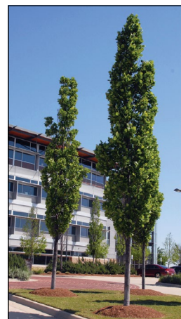
Tulipanero (Tabla 3)