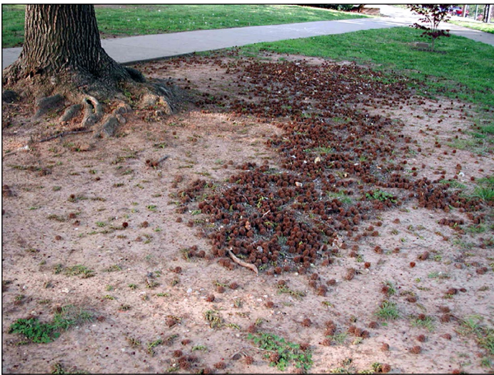
Liquidámbar - frutos que ensucian