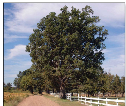
Roble blanco (Tabla 4)