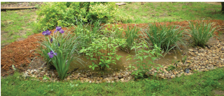
Figura 1. Ejemplos de jardines pluviales.